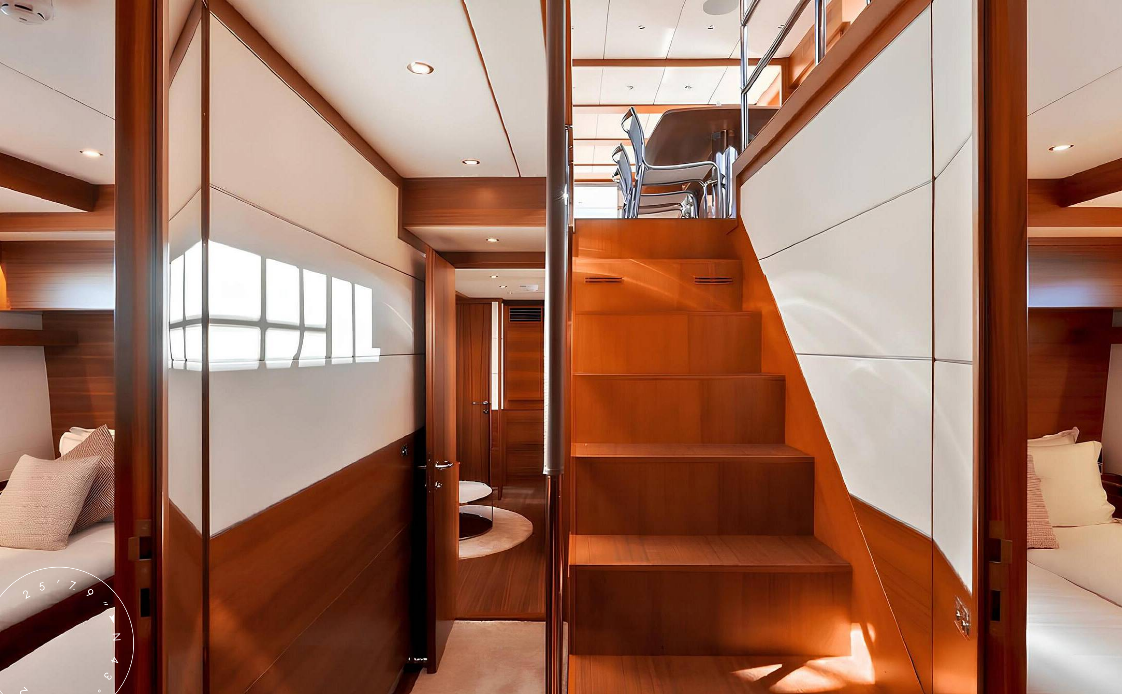
ЛЕСТНИЦА С ГЛАВНОЙ ПАЛУБЫ НА НИЖНЮЮ