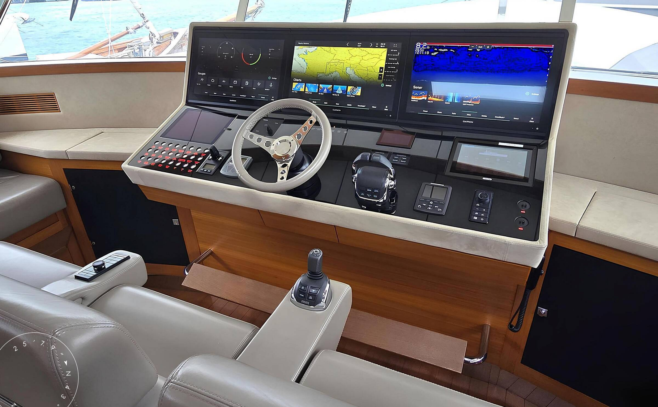
ГЛАВНЫЙ ПОСТ УПРАВЛЕНИЯ