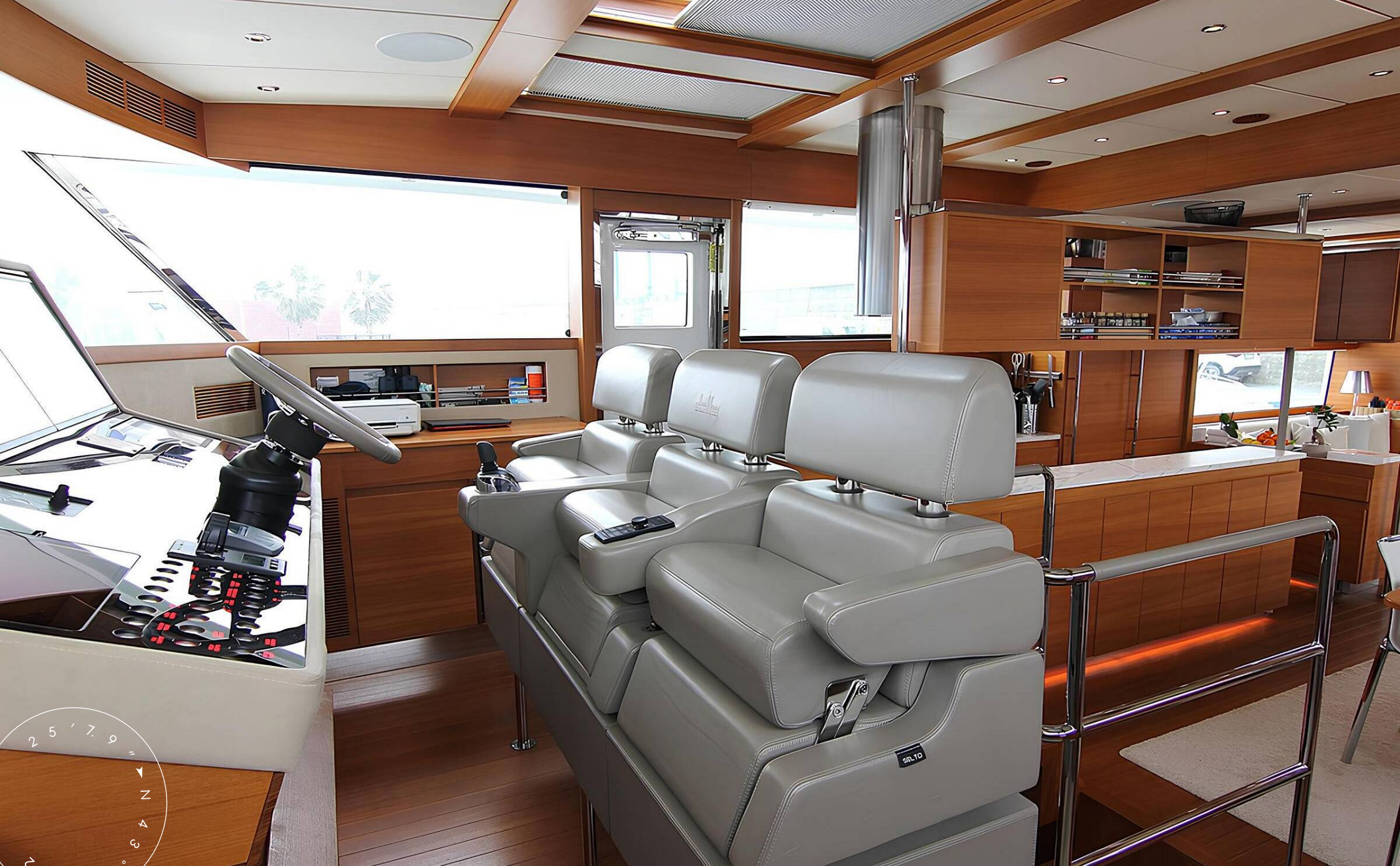
ГЛАВНЫЙ ПОСТ УПРАВЛЕНИЯ