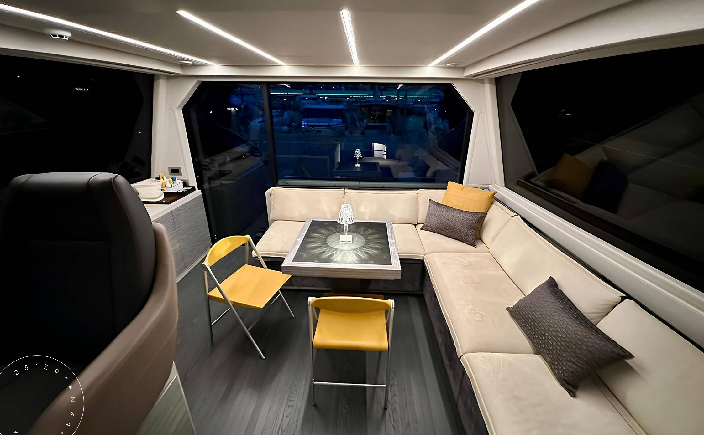
ЗОНА ОТДЫХА В ГЛАВНОМ САЛОНЕ