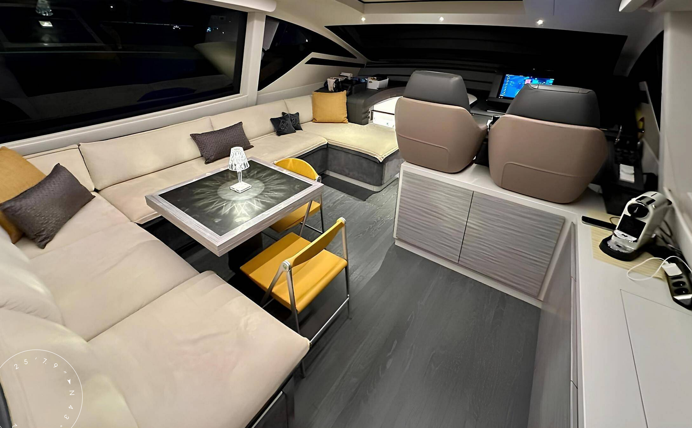
ЗОНА ОТДЫХА В ГЛАВНОМ САЛОНЕ