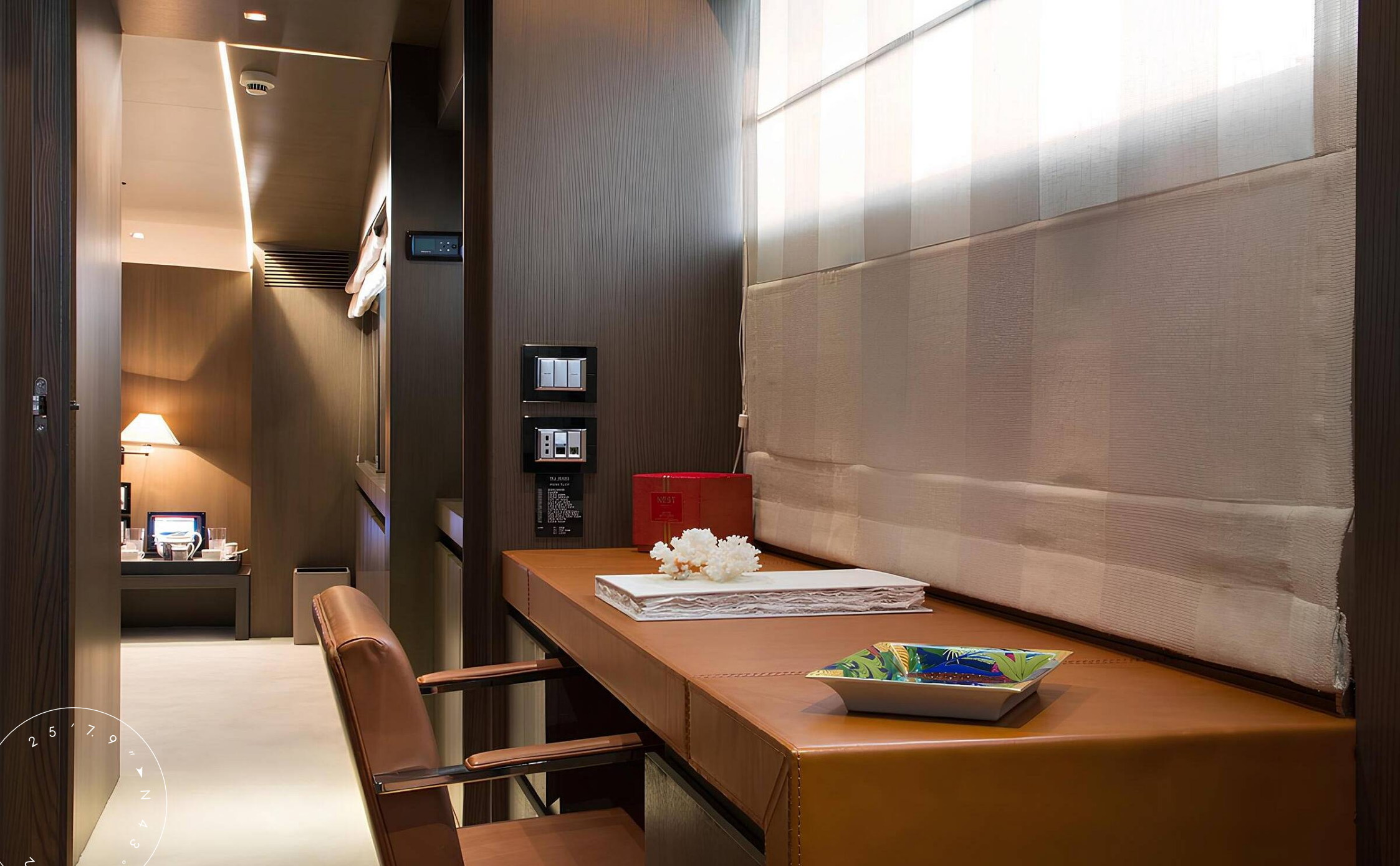
КАБИНЕТ В КАЮТЕ ВЛАДЕЛЬЦА