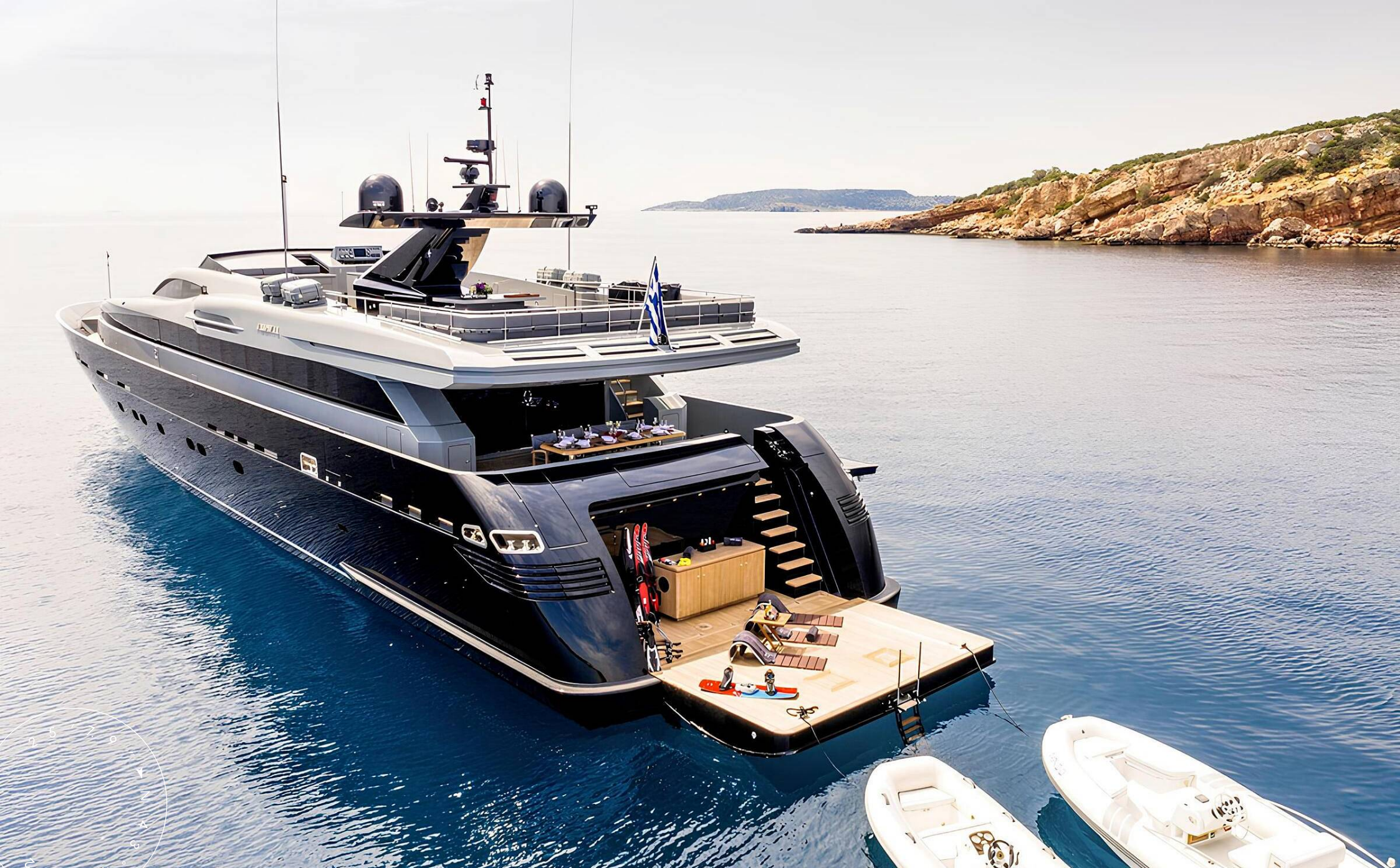
ЭКСТЕРЬЕР ADMIRAL 40M 2009 MY MADO