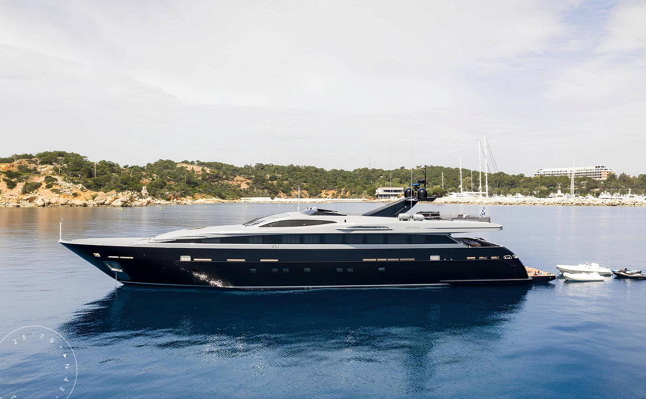
ЭКСТЕРЬЕР ADMIRAL 40M 2009 MY MADO