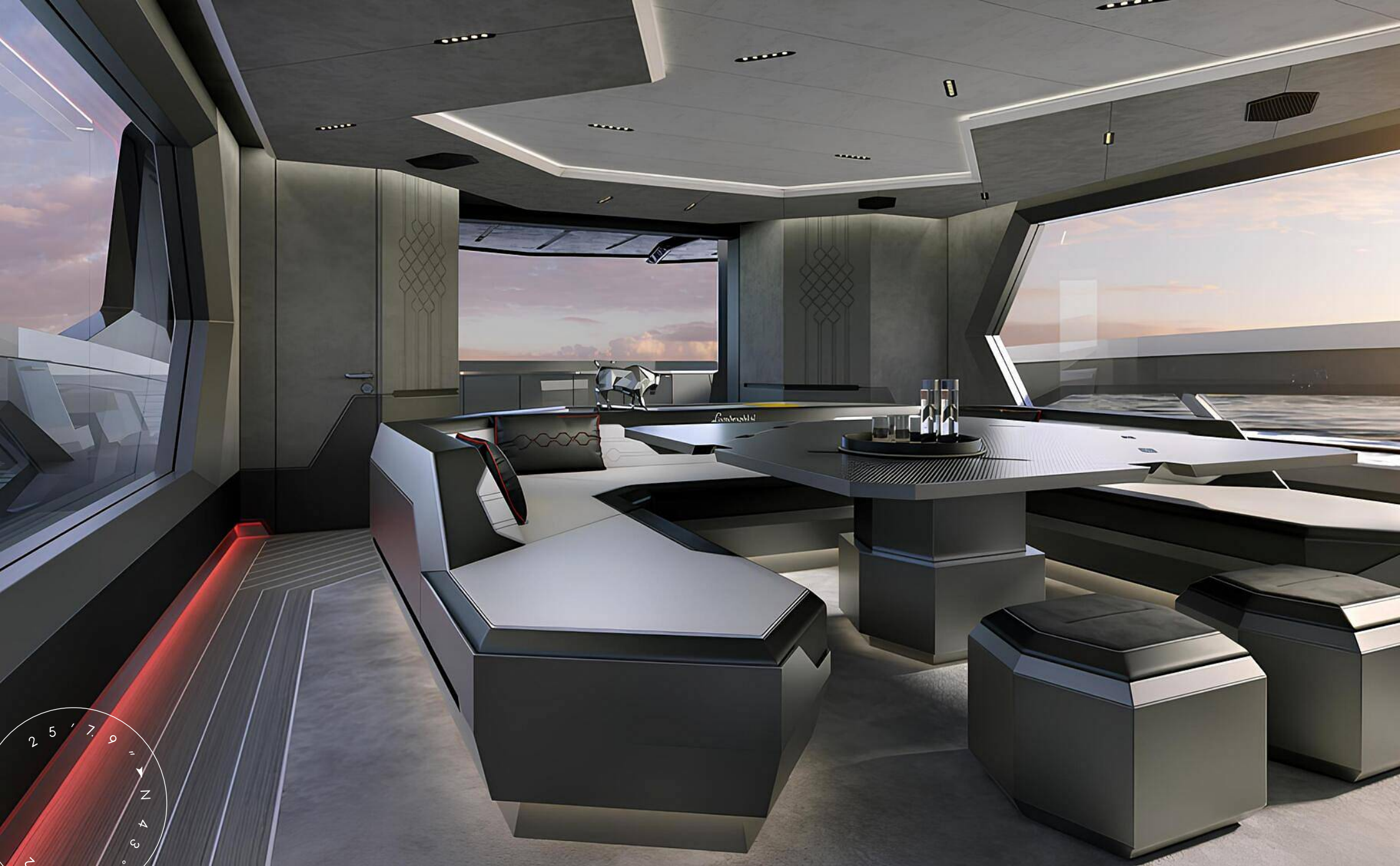
ОБЕДЕННАЯ ЗОНА В ГЛАВНОМ САЛОНЕ