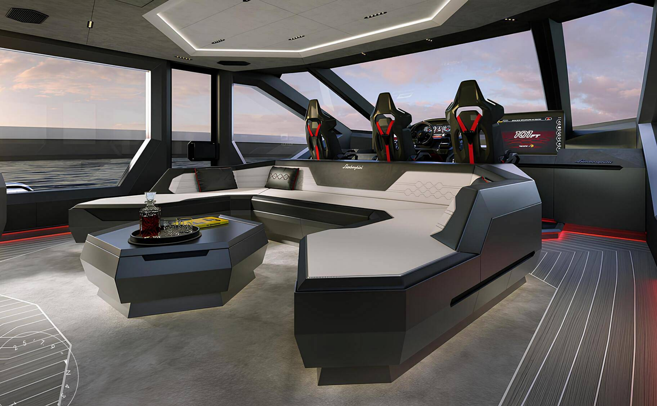
ЗОНА ОТДЫХА В ГЛАВНОМ САЛОНЕ