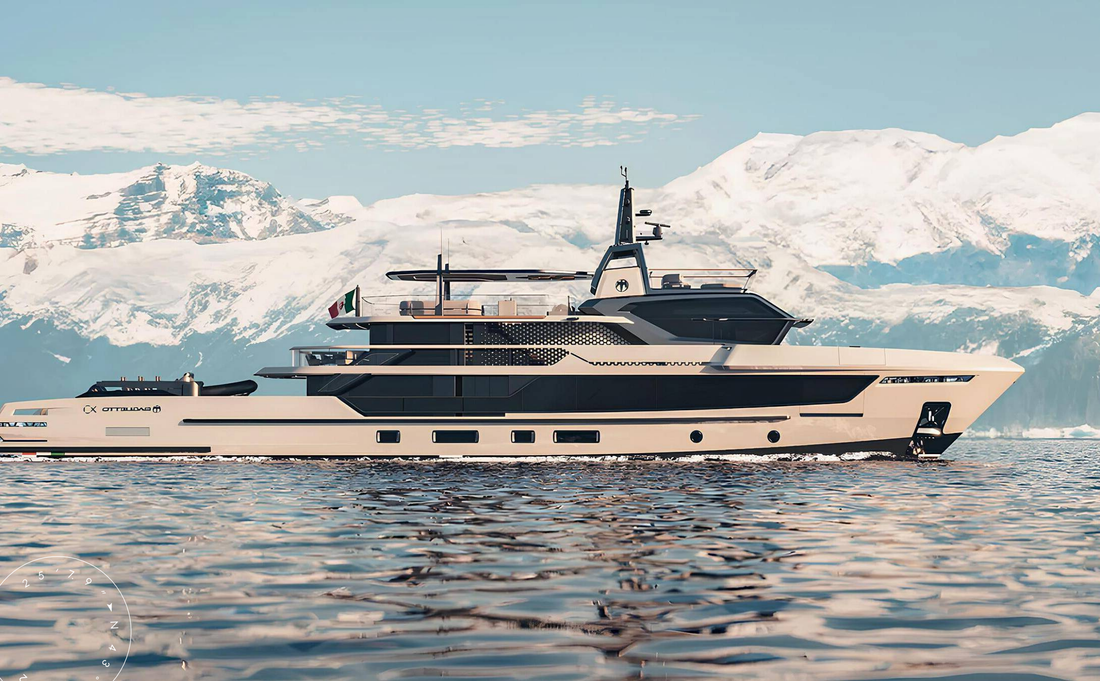
ЭКСТЕРЬЕР BAGLIETTO X50 NEW