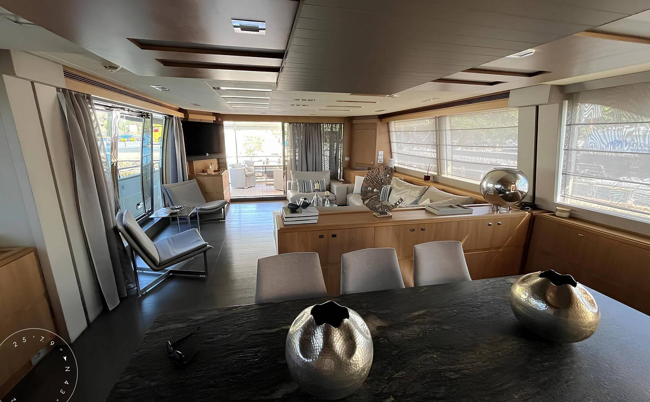
ОБЕДЕННАЯ ЗОНА В ГЛАВНОМ САЛОНЕ