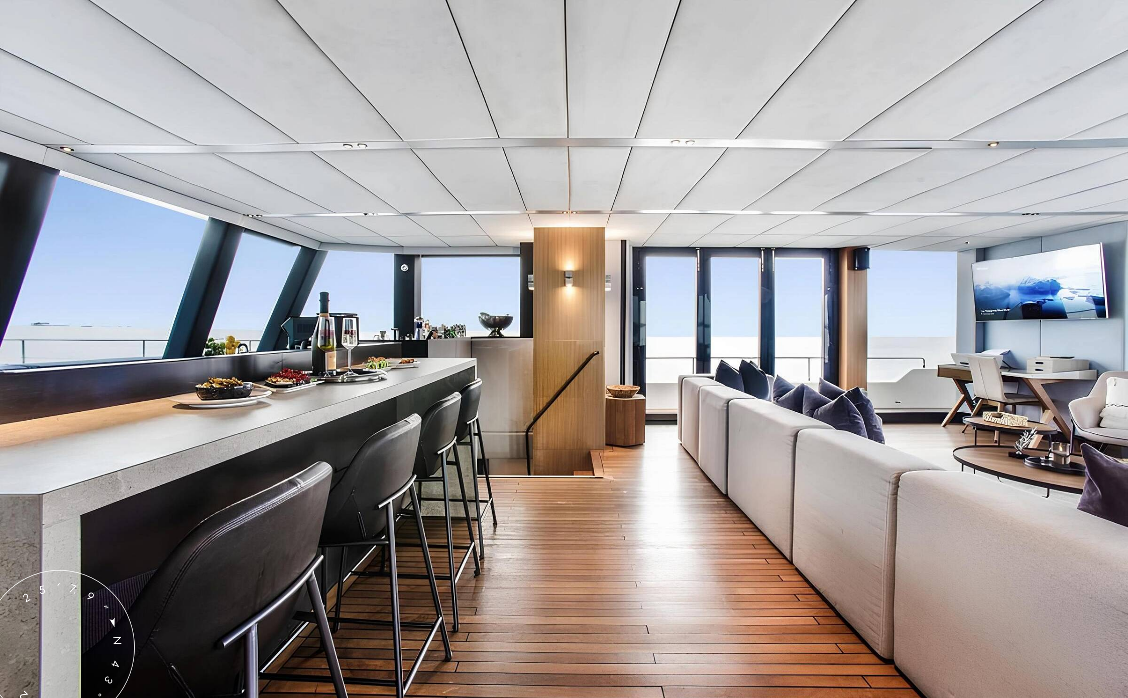
БАР В ГЛАВНОМ САЛОНЕ