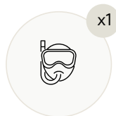
Маски и ласты