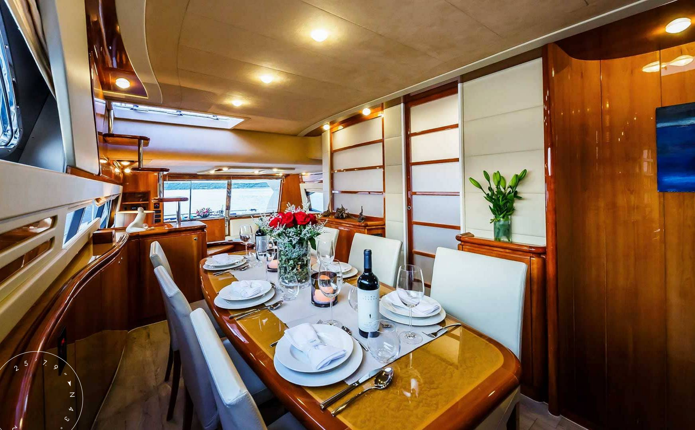
ОБЕДЕННАЯ ЗОНА В ГЛАВНОМ САЛОНЕ