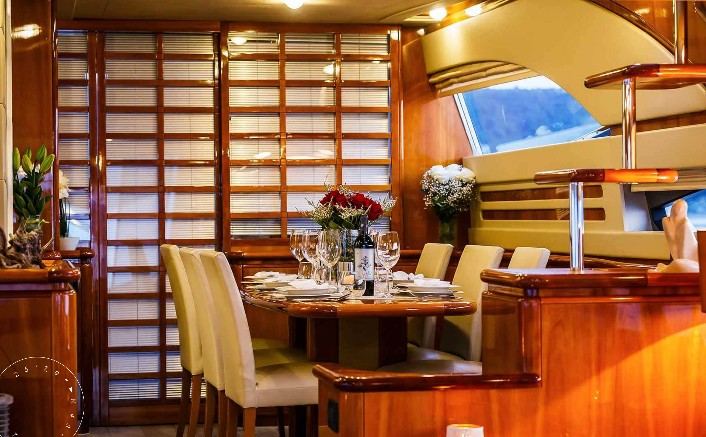
ОБЕДЕННАЯ ЗОНА В ГЛАВНОМ САЛОНЕ