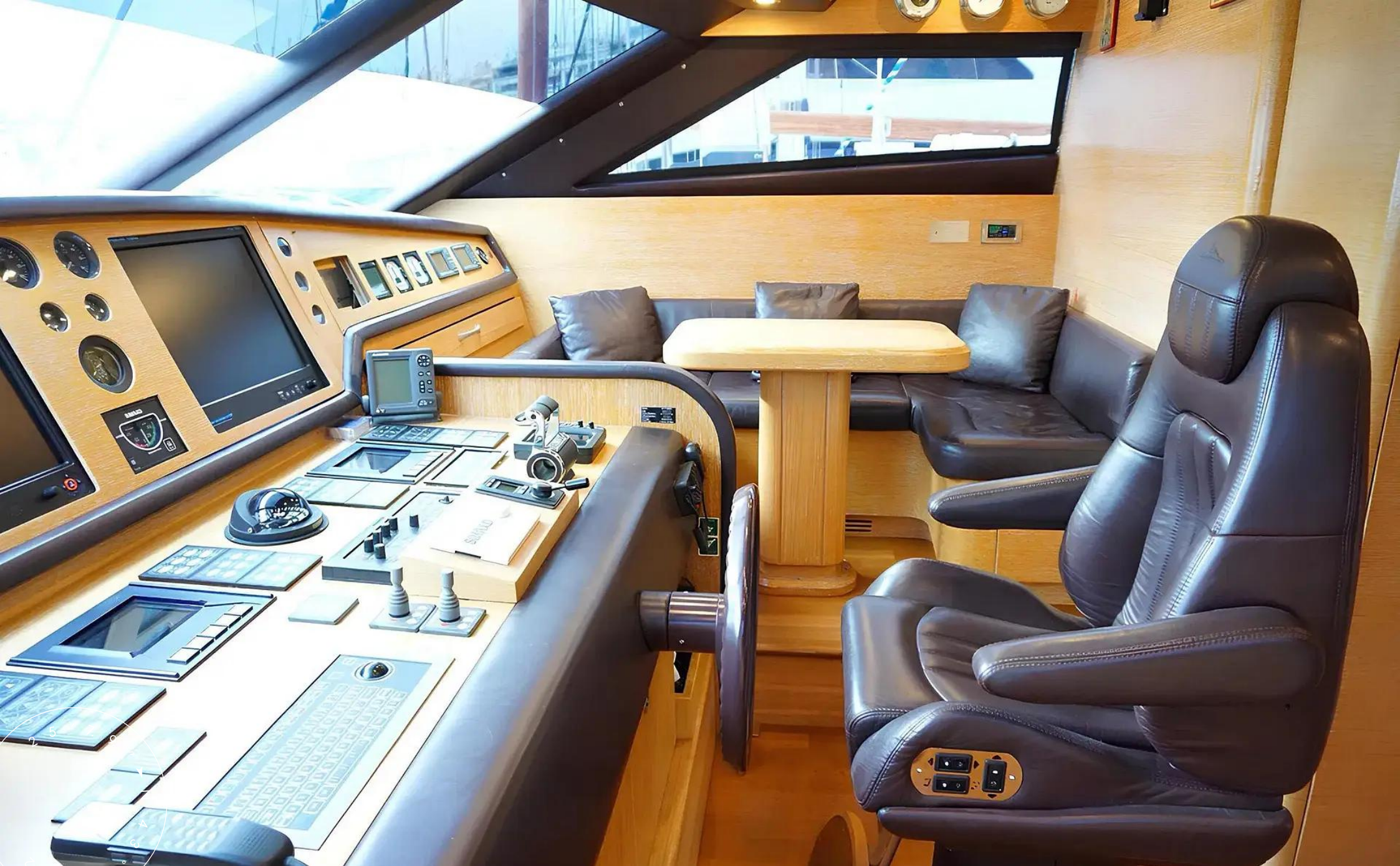
ГЛАВНЫЙ ПОСТ УПРАВЛЕНИЯ