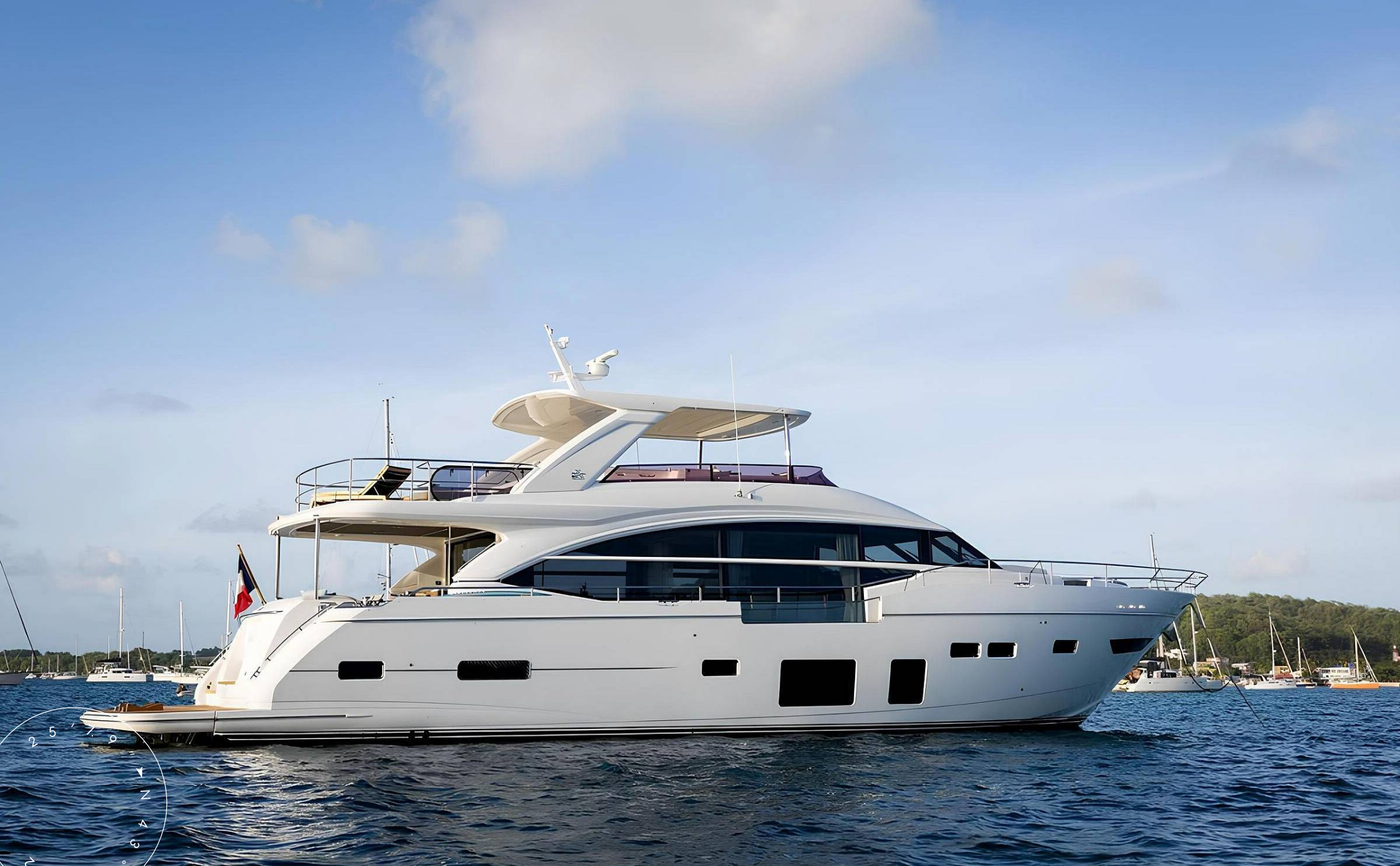
ЭКСТЕРЬЕР PRINCESS 75 2018 MY SORANA