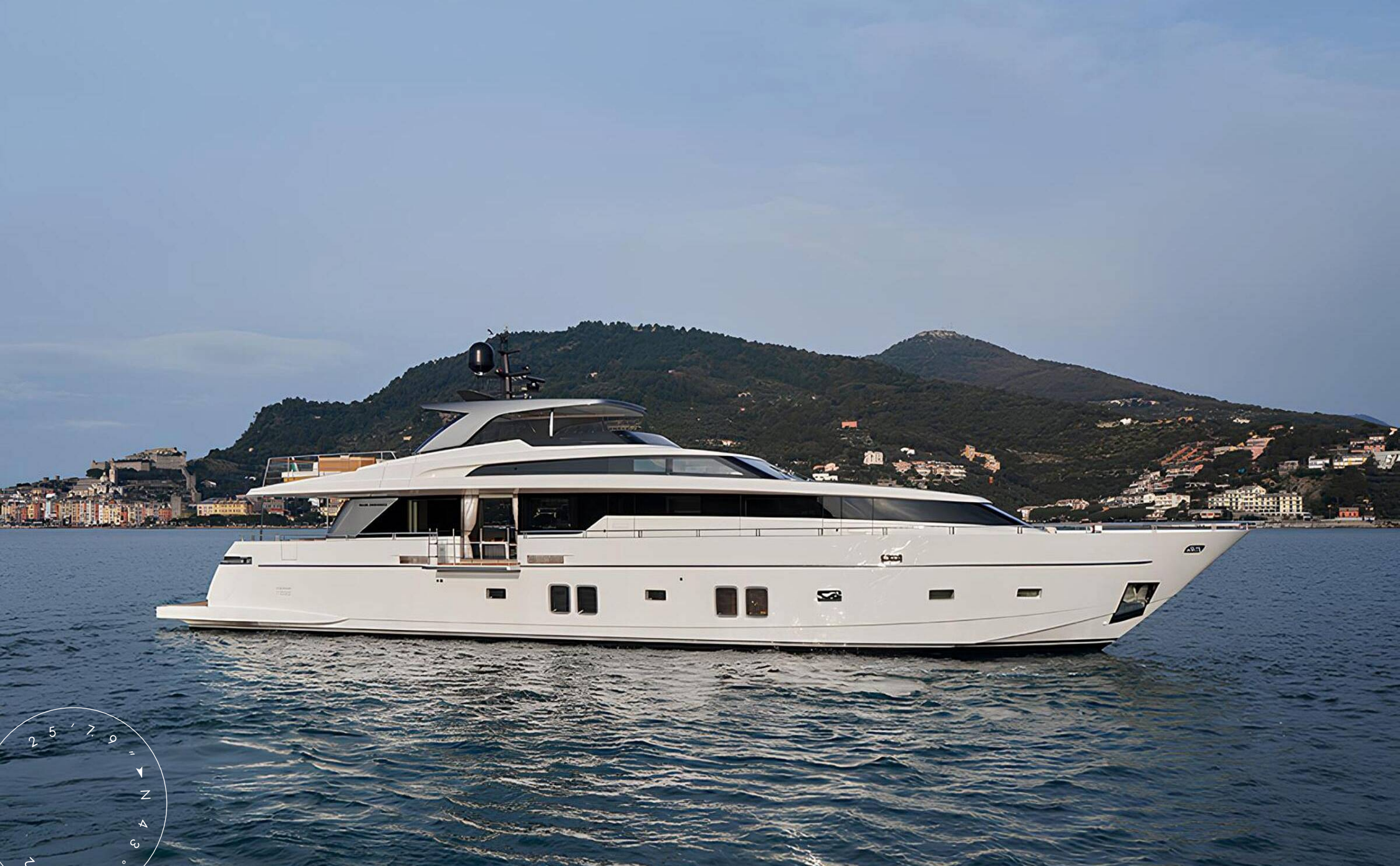
ЭКСТЕРЬЕР SANLORENZO SL106 2020 MY VITTORIA