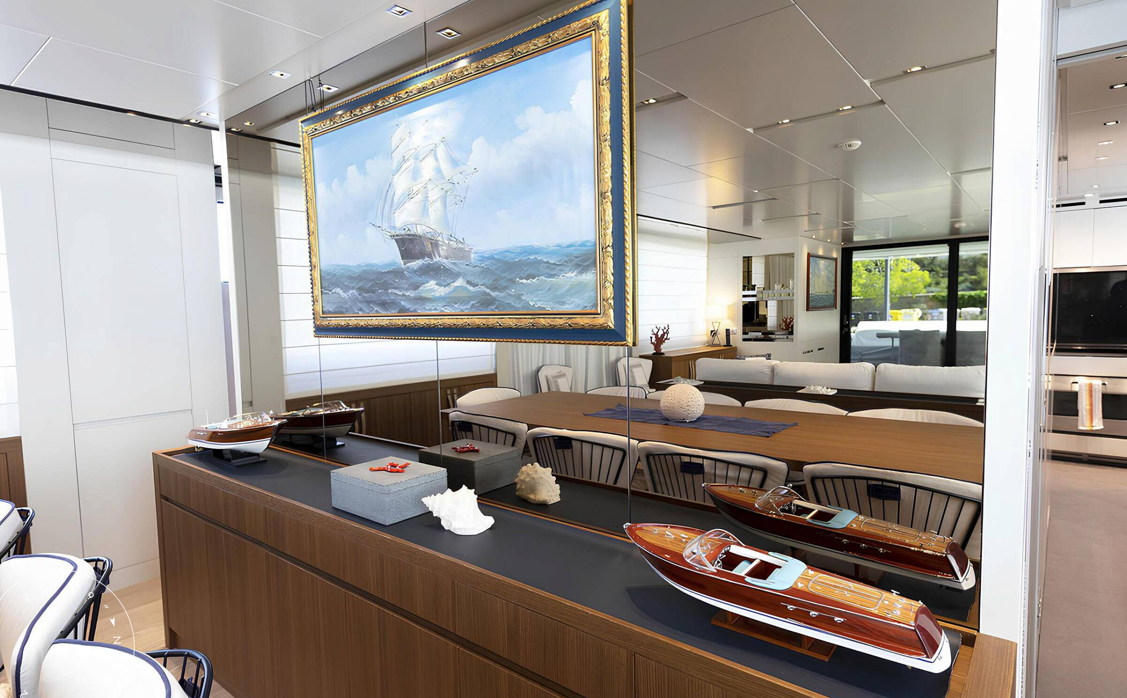
ЗОНА ОТДЫХА В ГЛАВНОМ САЛОНЕ