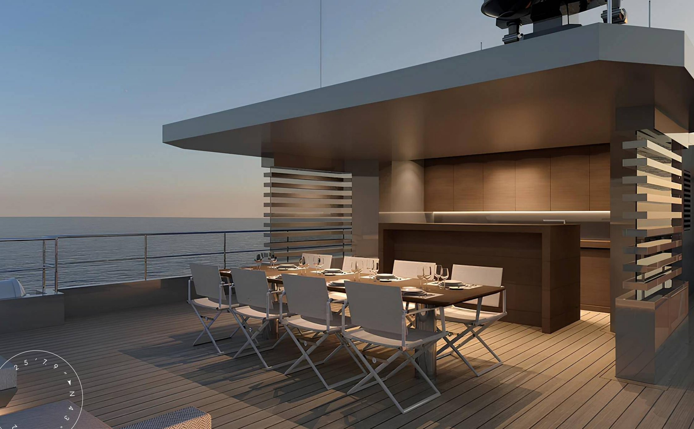
ОБЕДЕННАЯ ЗОНА НА КОРМЕ ВЕРХНЕЙ ПАЛУБЫ