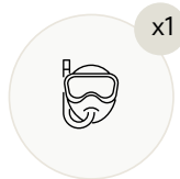
Маски и ласты