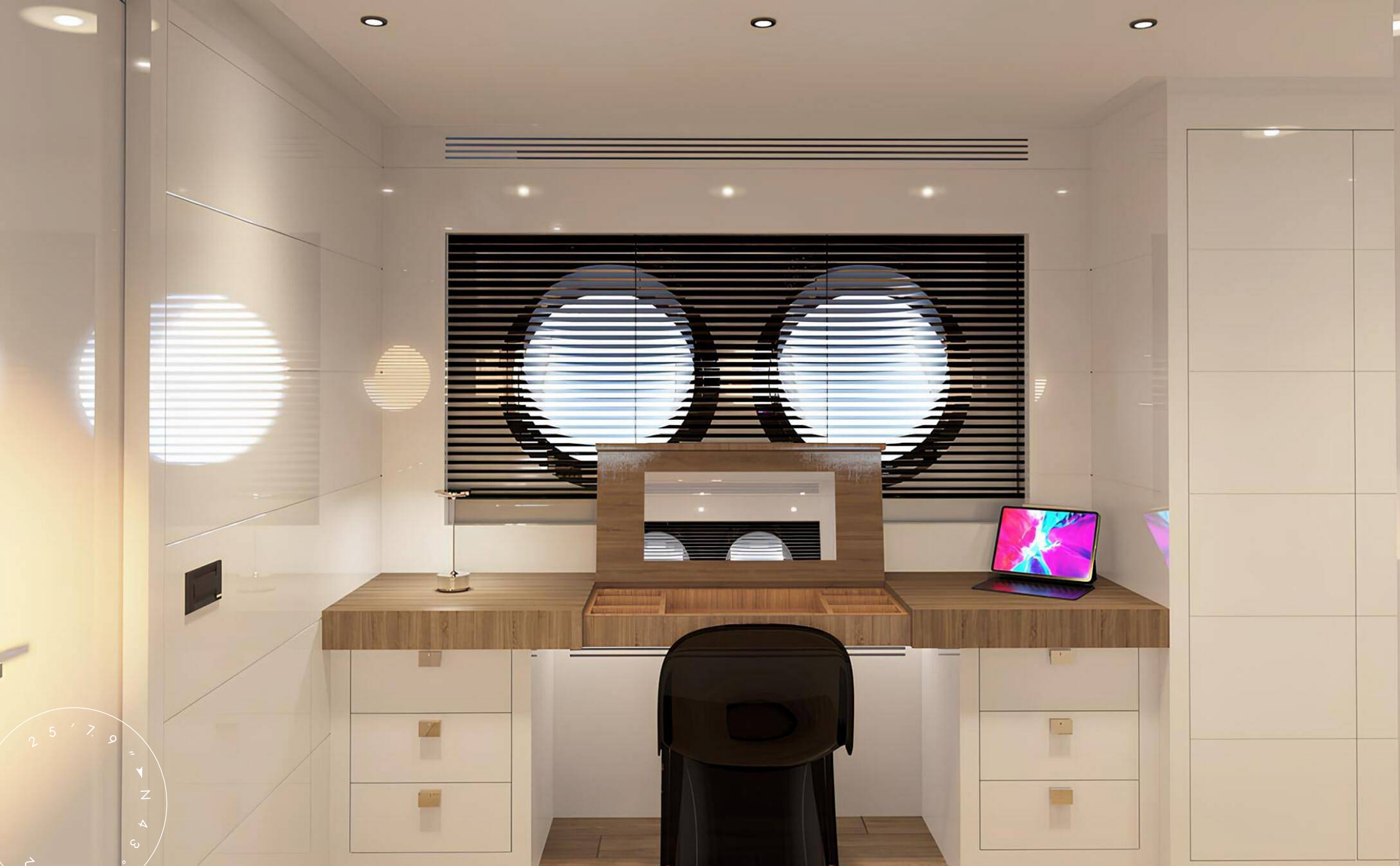
СТОЛИК ДЛЯ МАКИЯЖА В КАЮТЕ ВЛАДЕЛЬЦА