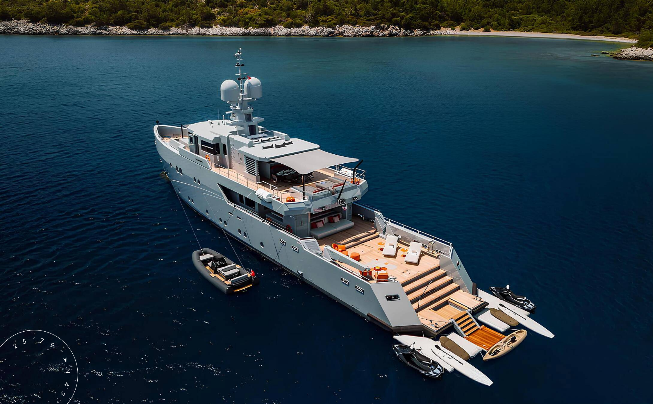
ЭКСТЕРЬЕР АЕГЕАН YACHT 37M 2025 MY CARMEN