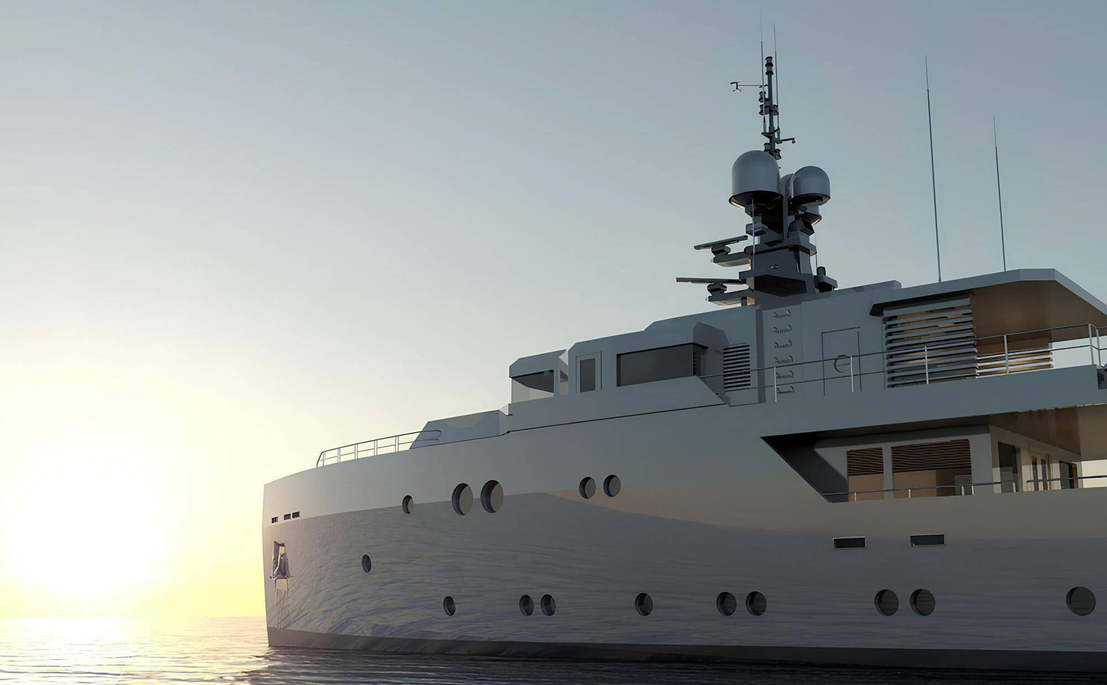
ЭКСТЕРЬЕР АЕГЕАН YACHT 37M 2025 MY CARMEN