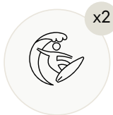
Доска для вейксерфа