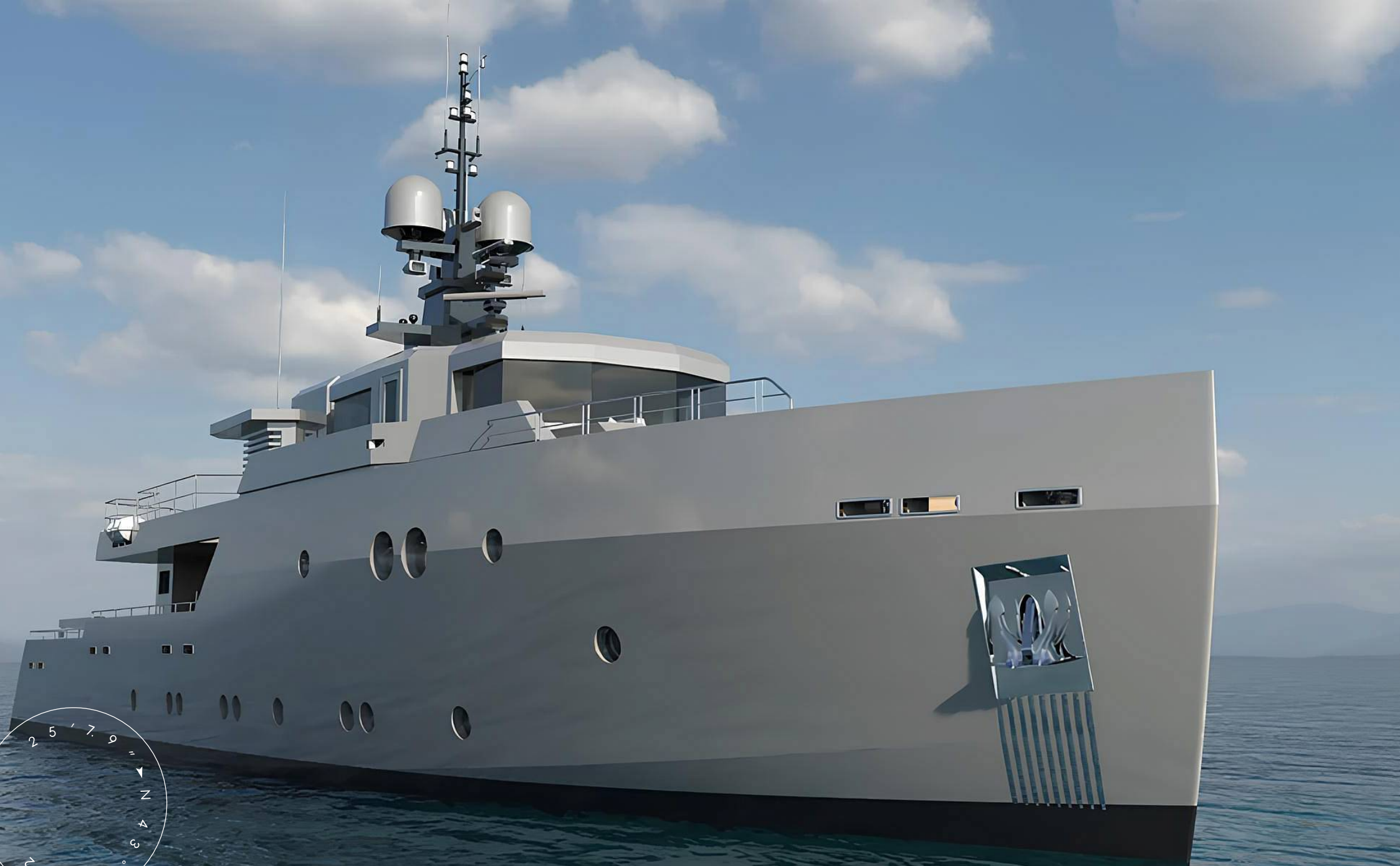
ЭКСТЕРЬЕР АЕГЕАН YACHT 37M 2025 MY CARMEN