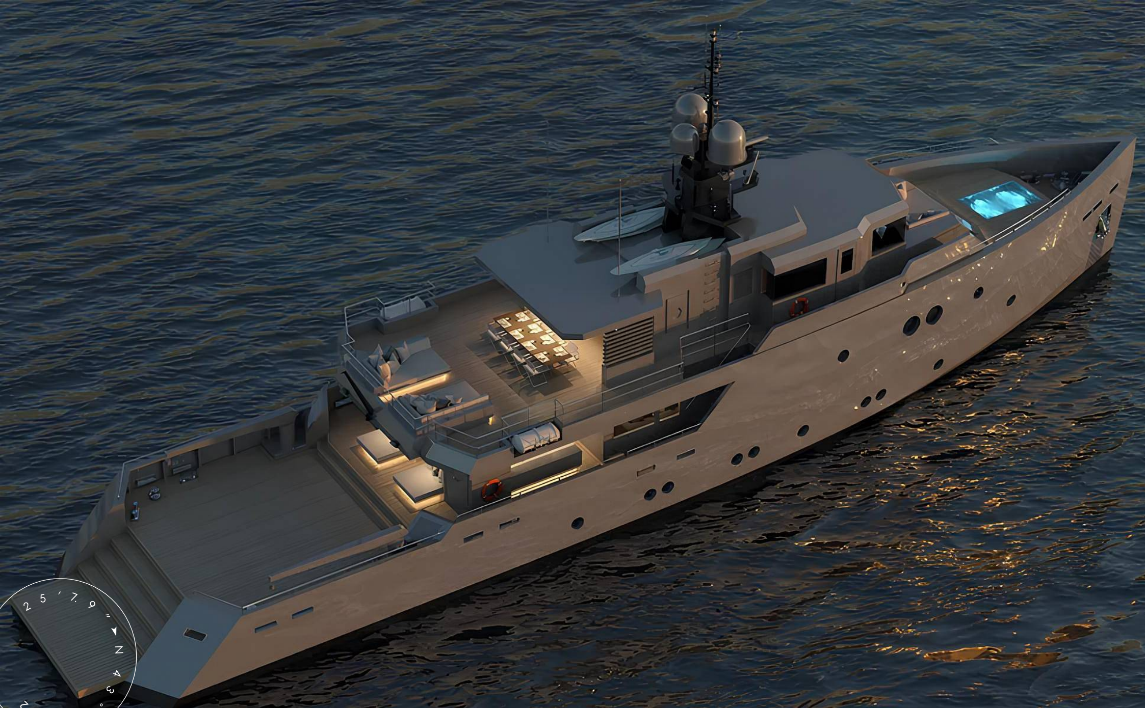
ЭКСТЕРЬЕР АЕГЕАН YACHT 37M 2025 MY CARMEN