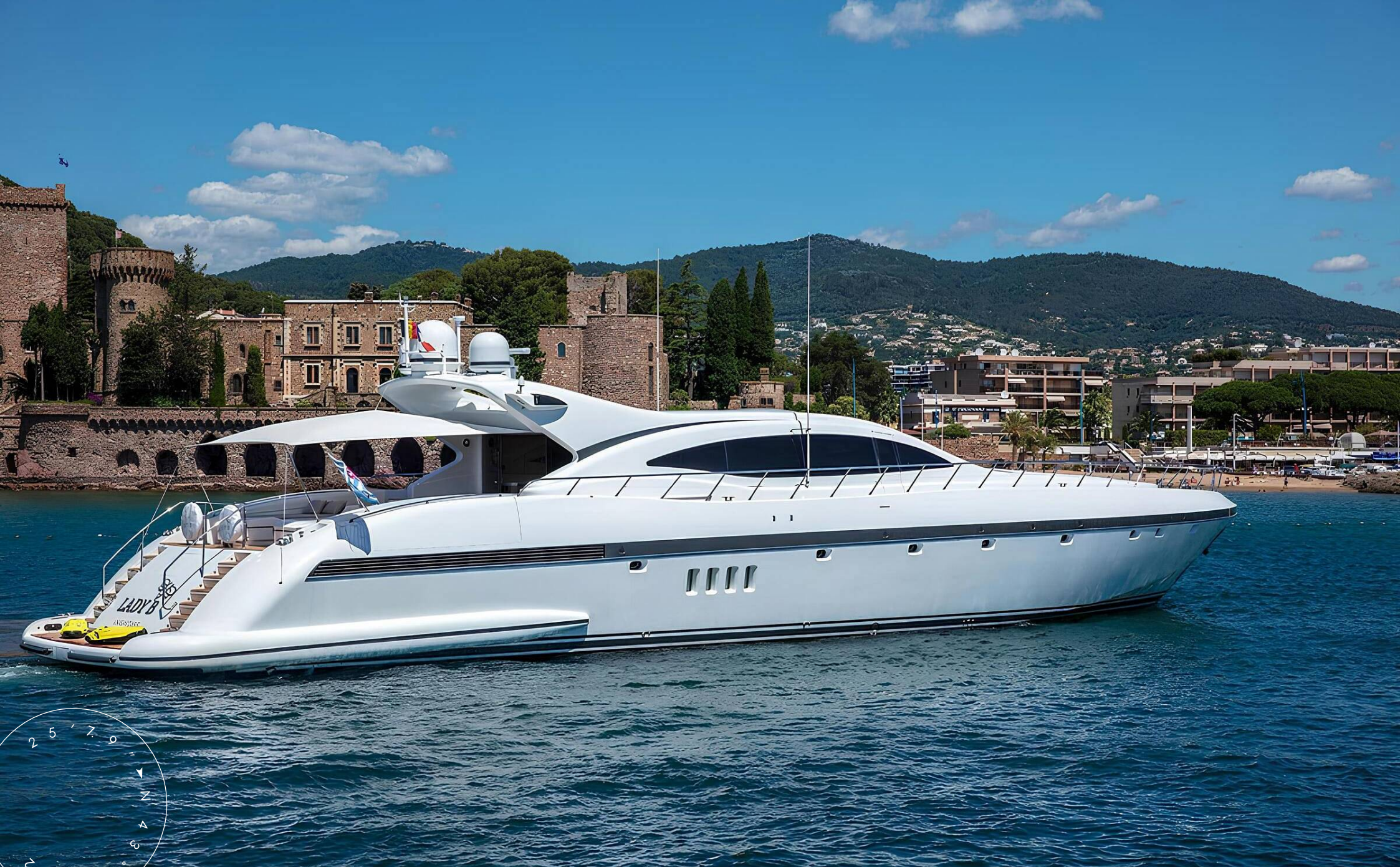
ЭКСТЕРЬЕР MANGUSTA (OVERMARINE) 108 2004 MY LADY B