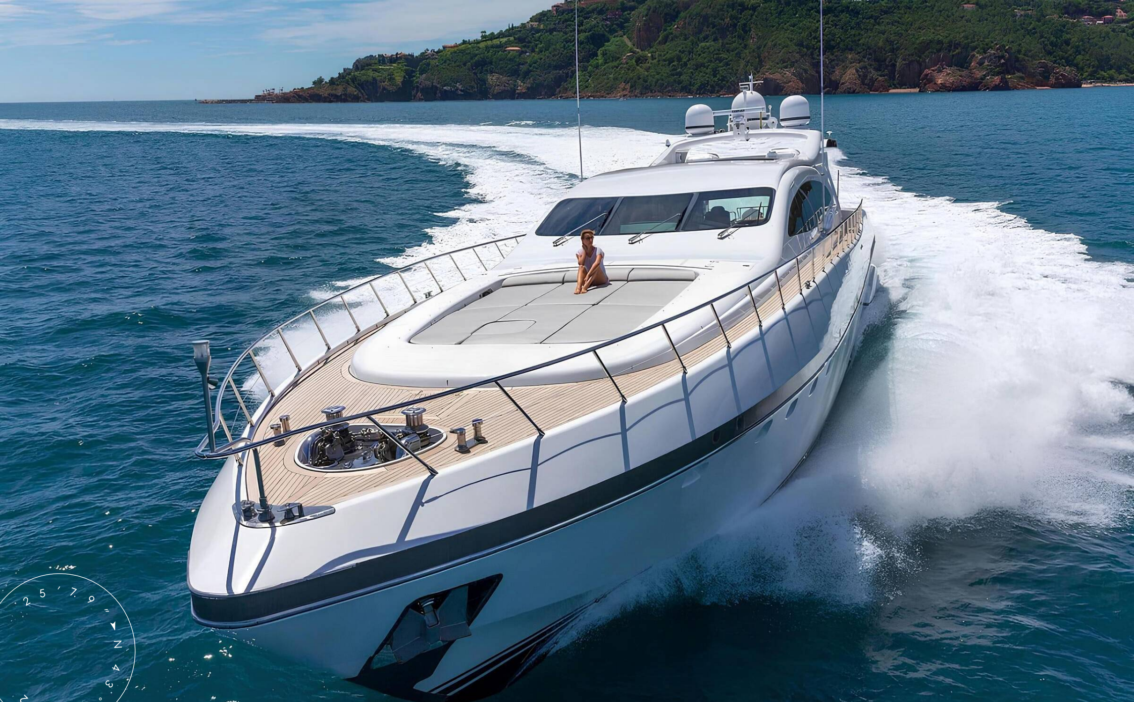
ЭКСТЕРЬЕР MANGUSTA (OVERMARINE) 108 2004 MY LADY B