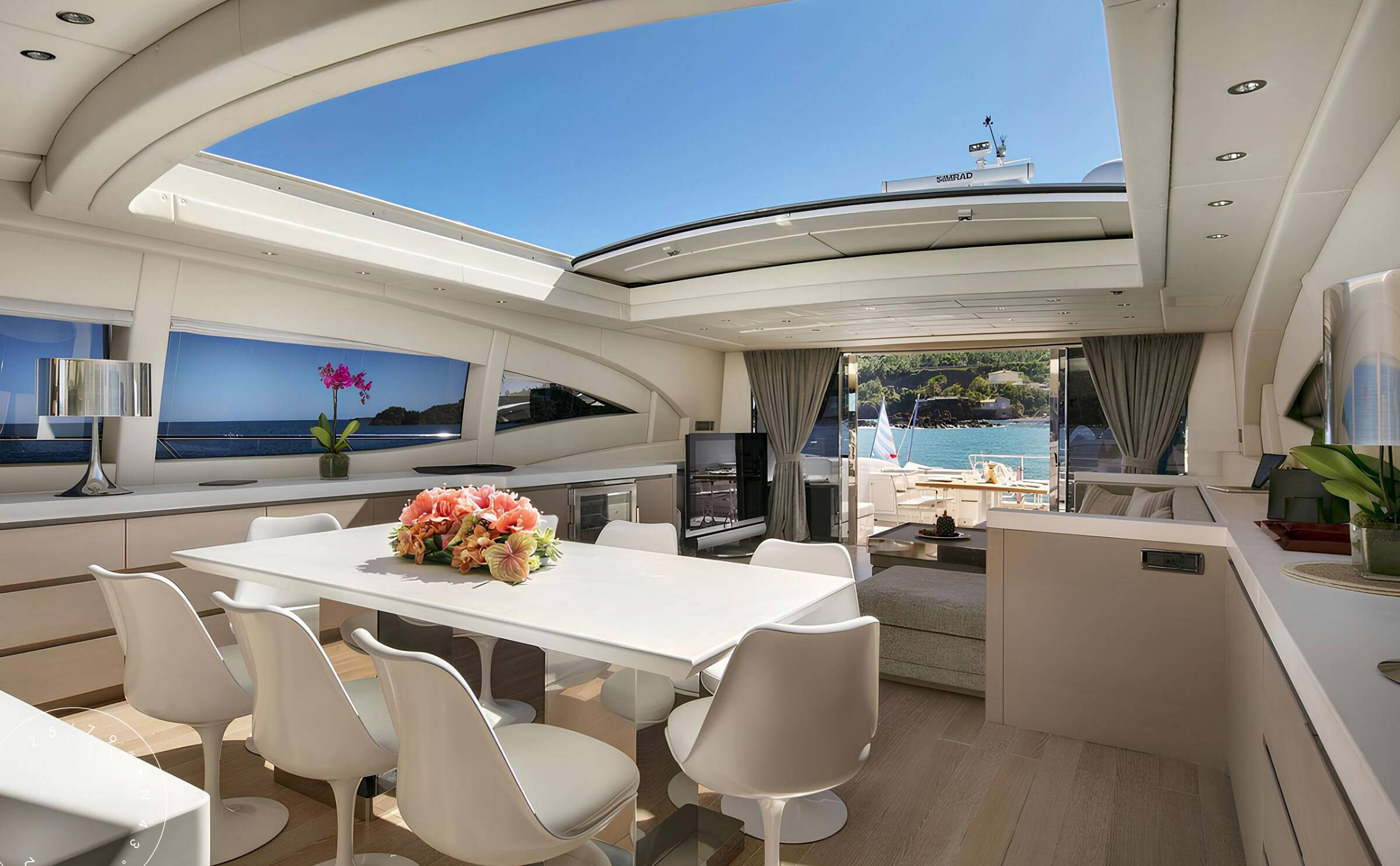
ОБЕДЕННАЯ ЗОНА В ГЛАВНОМ САЛОНЕ