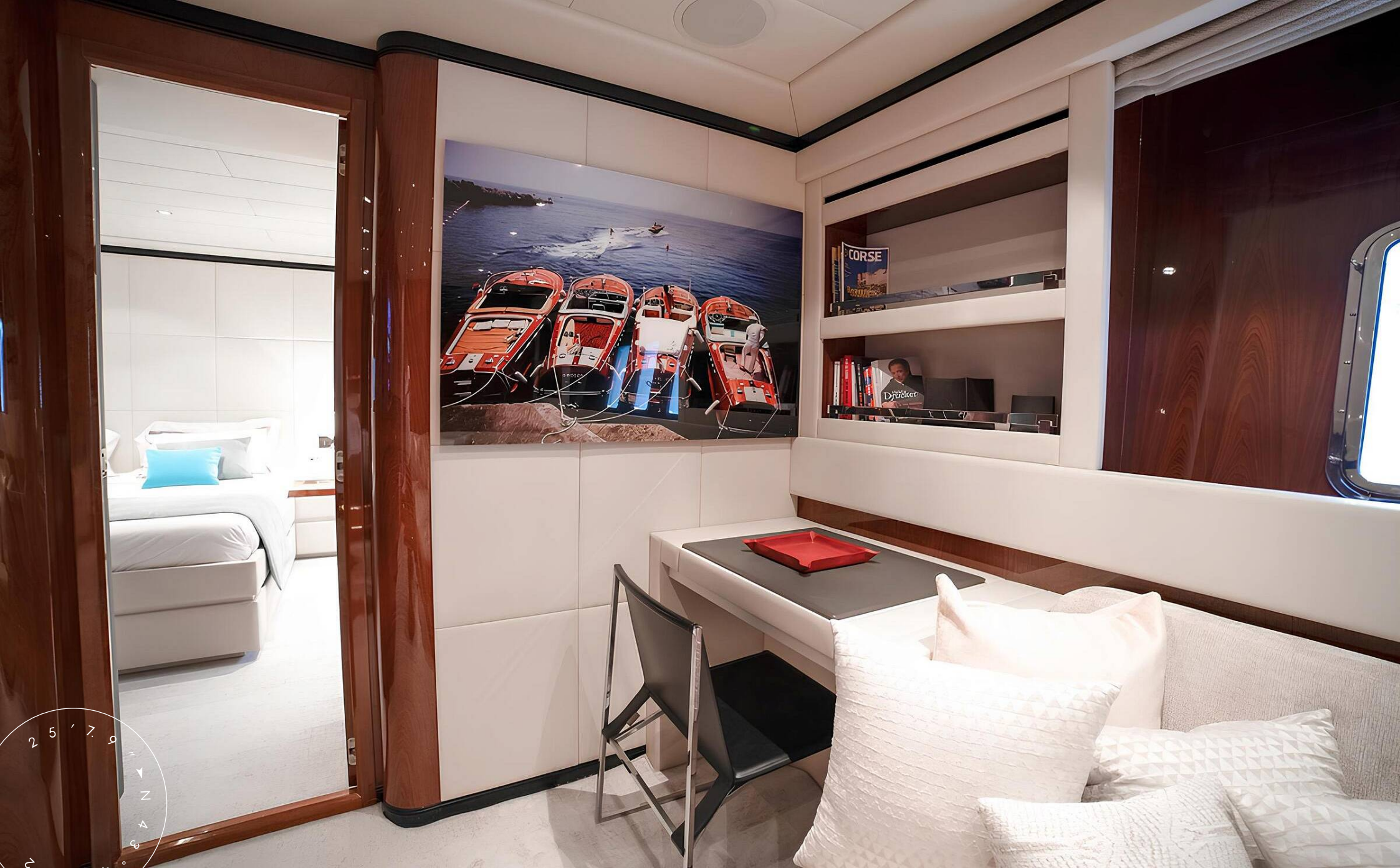
КАБИНЕТ В МАСТЕР КАЮТЕ