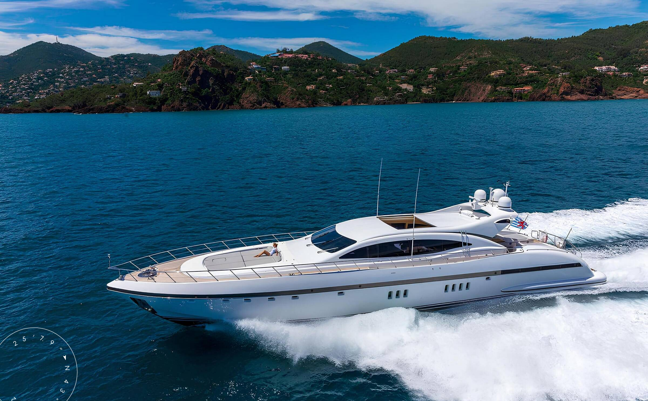
ЭКСТЕРЬЕР MANGUSTA (OVERMARINE) 108 2004 MY LADY B