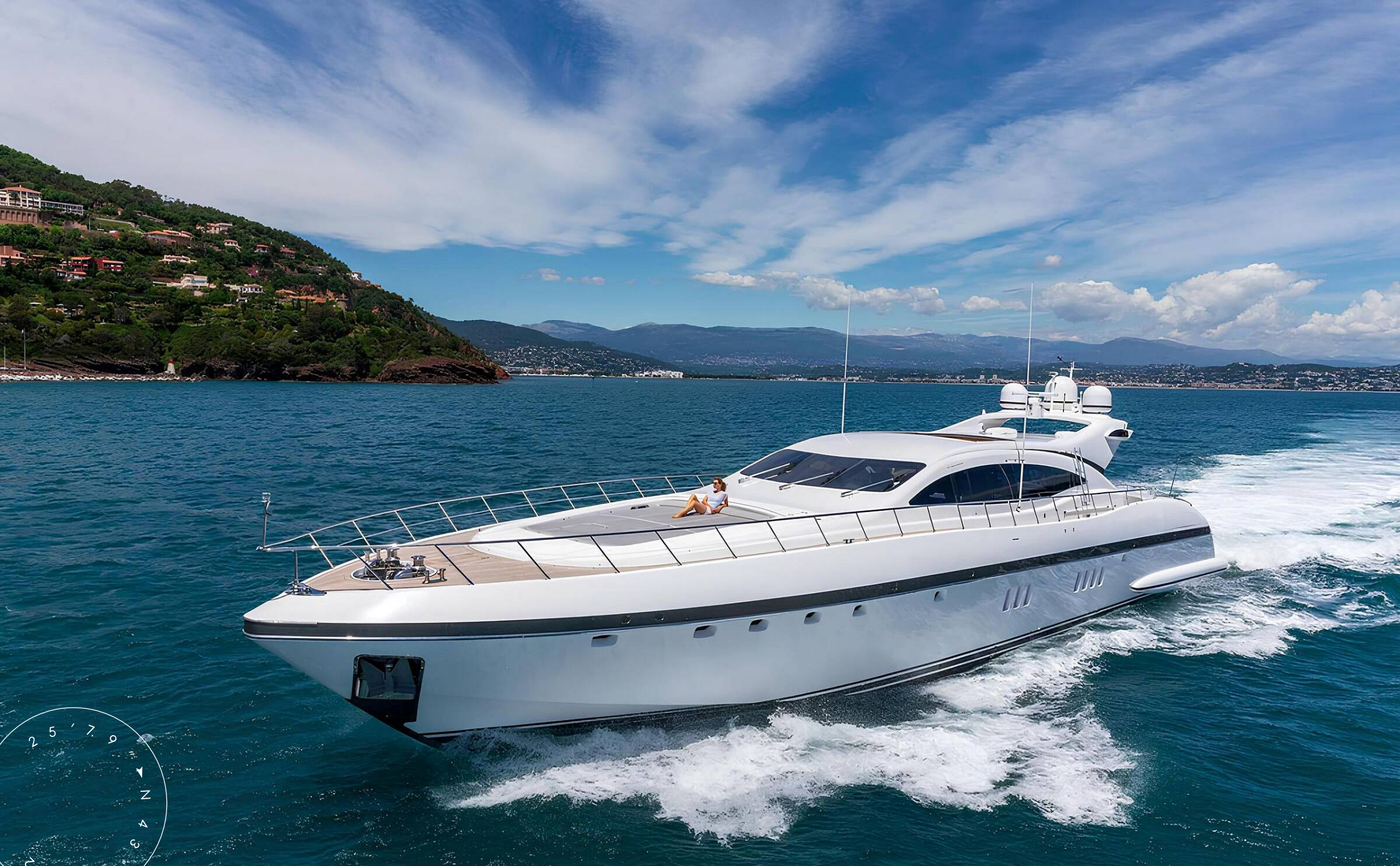
ЭКСТЕРЬЕР MANGUSTA (OVERMARINE) 108 2004 MY LADY B