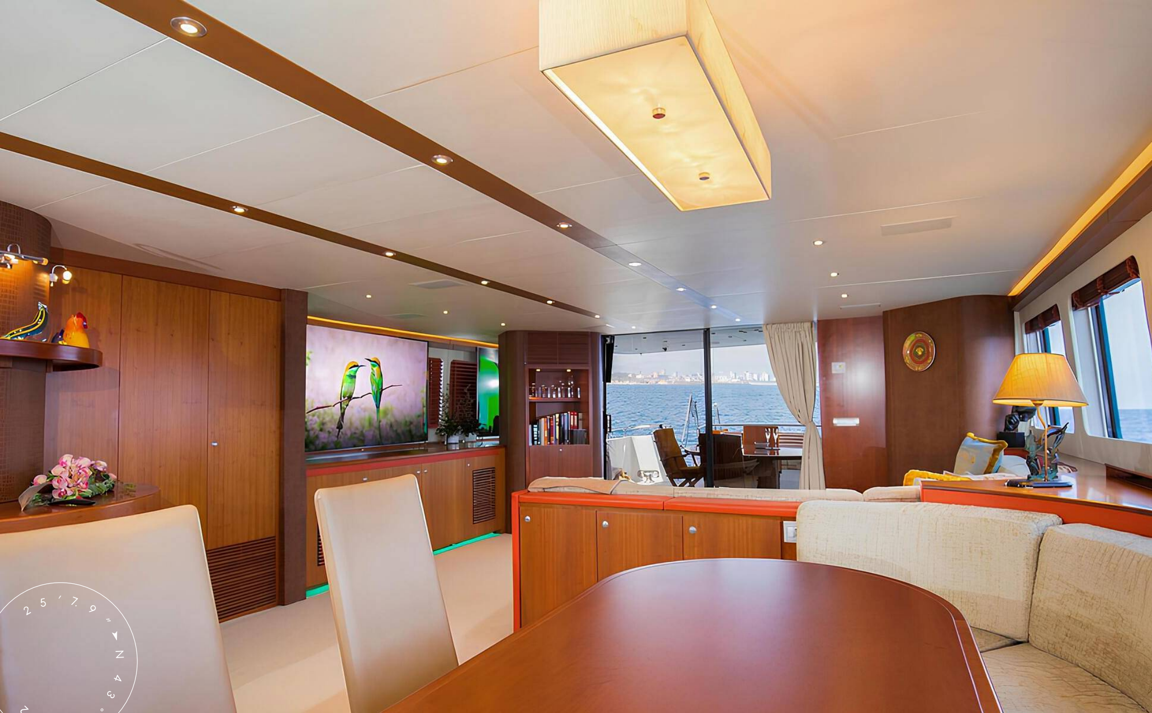
ОБЕДЕННАЯ ЗОНА В ГЛАВНОМ САЛОНЕ